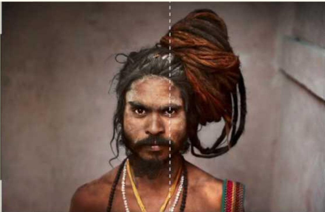
Още един добър пример за акцент върху едното око.