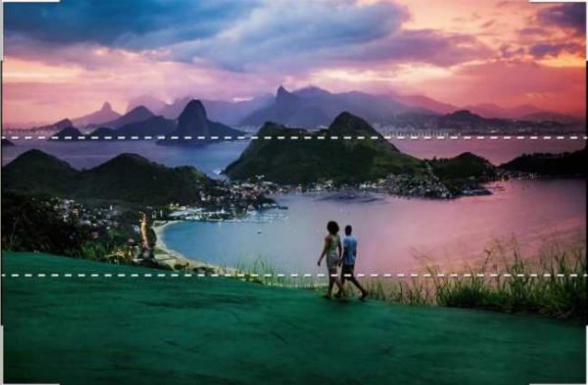
Три линии разделят добрия фотографски кадър.