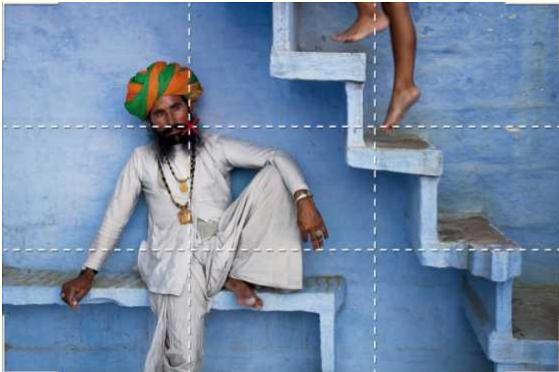
Девет правоъгълника съставят мозайката на снимка, изпълнена със симетрия.